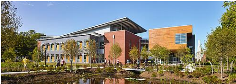
Virginia Wesleyan University, USA