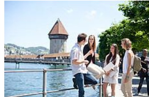
Pädagogische Hochschule Luzern, Schweiz