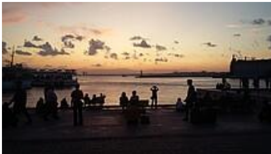
Marmara University, Türkei