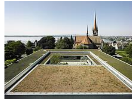
Pädagogische Hochschule Zug, Schweiz